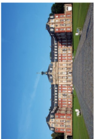
1 Schloss (18/9)