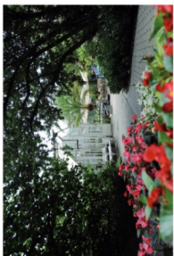
2 Botanischer Garten (18/9)