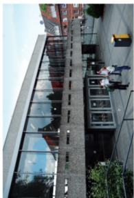
9 Hörsaalgebäude (L9)