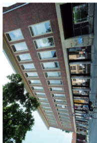
16 Fürstenberghaus (N10)